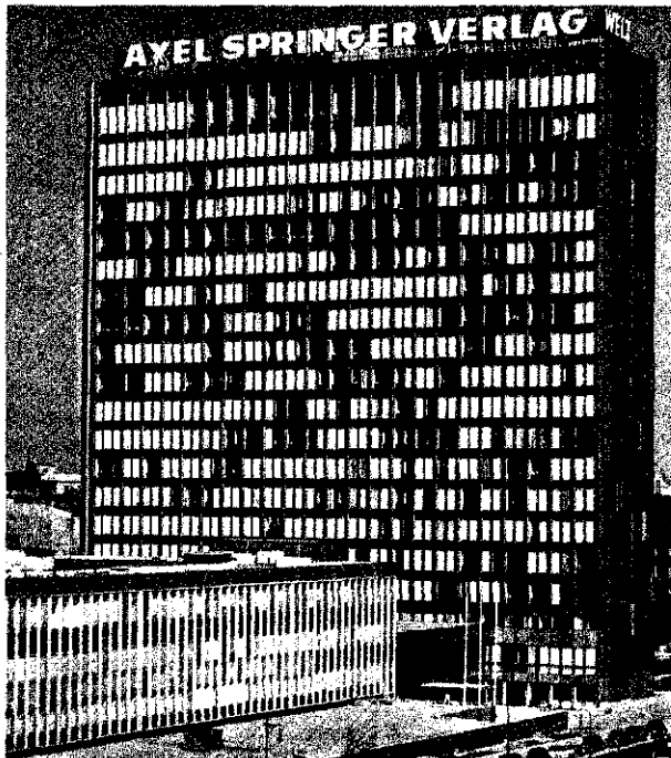
Springer-Haus in Berlin: Vor dem Druckhaus Widerstand...

DUTSCHKE: In der Vergeudungsgesellschaft, würde ich sagen. Denn die für profit- und herrschaftsorientierte Gesellschaftsordnungen typischen Konsumtionsexzesse — Kriege sowie die ungeheuren toten Kosten; Rüstung, unnütze Verwaltung und